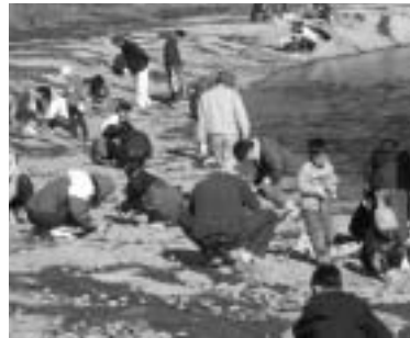
昨年度の化石採集の様子