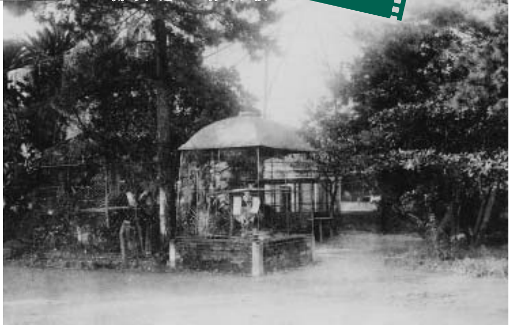
写真/向山に移転した頃の動物園