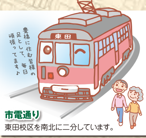
市電通り 東田校区を南北に二分しています。