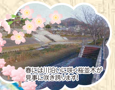
春には川沿いに咲く桜並木が見事に咲き誇ります!!

豊橋競輪場 昭和24年に完成、営業を開始している。競輪場の北側の朝倉川沿いには、春には桜、つつしがきれいに見られます。