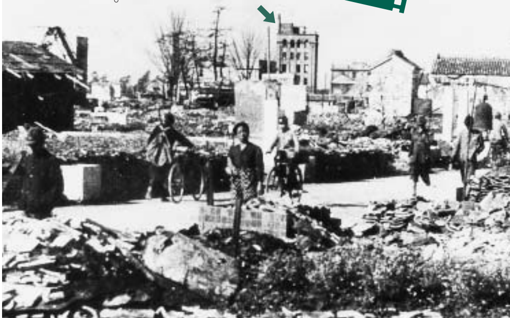
写真/焼け野原となった札木町付近から額ビル(矢印)を望む