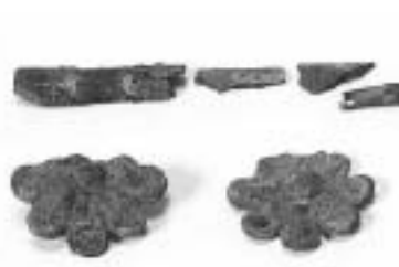
今下神明社古墳の馬具

容 弥生～古墳時代の出土品をもとに古代「三河国」の成立前に存在した「徳国」が誕生する過程を考古学的に検証します 展示品 吉田城址出土銅鏃(今橋町)、今下神明社古墳出土馬具(老津町)、欠山遺跡環濠出土土器(宝飯郡小坂井町)ほか 入場料 無料 問合せ 美術博物館(☎51・2879)