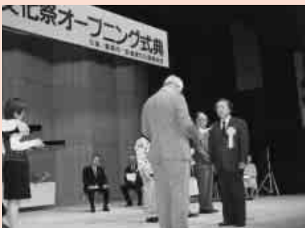
豊橋文化祭オープニング式典での表彰式の様子

▶対象 東三河在住の方▶作品 ①現代 詩/1人1編、原稿用紙20字×30行以内② 短歌・俳句・川柳/応募用紙または郵 便はがき使用で1部門2首(句)以内※① ②ともに縦書き・楷書、近作、未発表 の自作で、各部門1人1回の応募に限り ます▶賞 現代詩/特選1人、秀逸2人、 佳作7人、短歌・俳句・川柳/各部門・ 選者ごとに特選1人、秀逸3人、佳作16 人※特選、秀逸には賞状と賞品あり▶ 申し込み 6月30日(消印有効)までに 郵便番号、住所、氏名(ふりがな・ペン ネームの場合は本名も必要)、電話番号、 「郷土文芸〇〇の部(朱書)」を明記して、 文化課(〒440-8501住所不要☎51・2875) ※応募用紙は市民館、東三河文化施設 などにあります