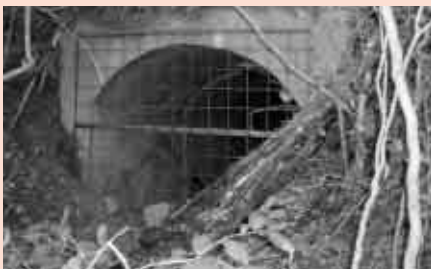
安全対策済みの防空壕(船渡町)

▼連絡先 都市計画課(☎51・2621 ☎56・5108) toshikeikaku@city.toyohashi.jp