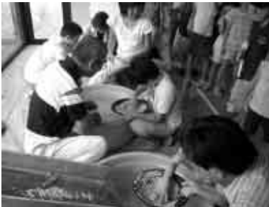
鉱物を選別しているようす

▶とき 7月31日(日)、8月7日(日)午後1時~3時▶ところ 地下資源館(大岩町字火打坂)▶内容 水の流れの力を使った鉱物の選別方法を体験します。小さな鉱物のプレゼントあり▶申し込み 不要▶参加料 無料▶問合せ先 地下資源館(☎41・2833)