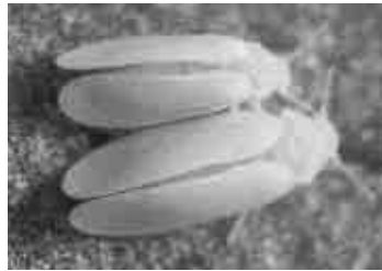
シルバーリーフコナジラミ (体長0.8mm淡黄色)

問合せ 農政課 (☎51・2475)、豊橋農協営農指導課 (☎25・3814)、東三河農林水産事務所農業改良普及課 (☎63・3529)