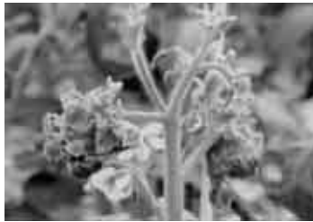
新芽に現れた葉巻症状 若い葉が黄色く変色し、葉が縮むように巻き込む典型的な症状が出たトマト