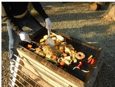
バーベキュー（こかげ広場）