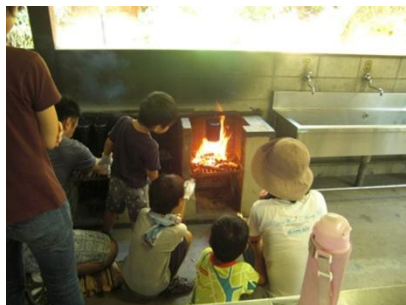
飯盒炊さん（炊事場）