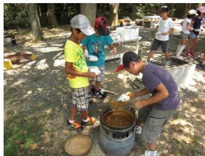
移動かまどでカレーづくり