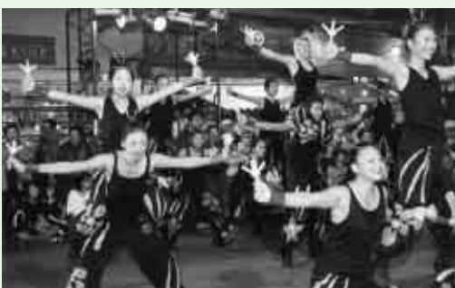
とんとん踊りコンテスト