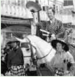
英傑パレード 歴代城主の部