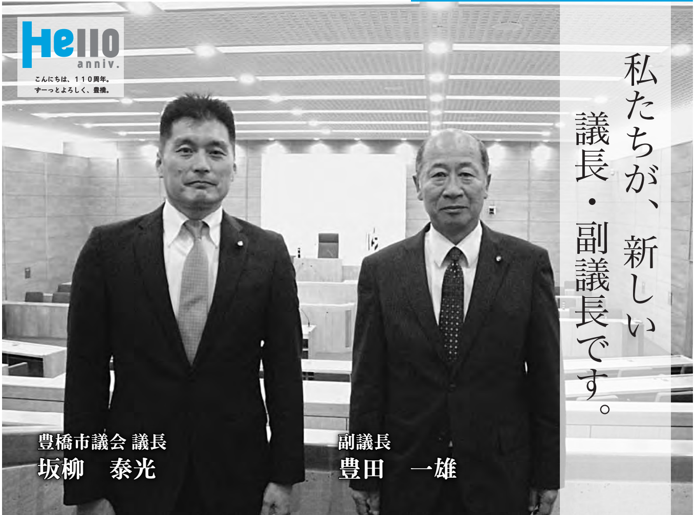
豊橋市議会 議長 坂柳 泰光