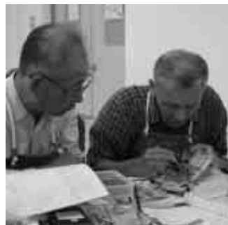
おもちゃ病院トントン