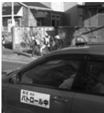
青パトによるパトロール

「共通事項」申し込み 申請用紙・申込用紙で市役所安全生活課(東館2階)※申請用紙・申込用紙は安全生活課で配付中