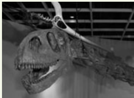
ユアンモウサウルス