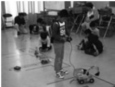
小型ロボットのリモコン操作

とき: 5月5日(祝)午後1時～3時(随時参加可) ところ: 視聴覚教育センター(大岩町字火打坂) 内容: サイエンス・ボランティアと一緒に、かんたんな工作、科学遊び体験、小型アームロボットのリモコン操作などを楽しみます 参加料: 無料 申し込み: 不要 問合せ先: 地下資源館(☎41・2833)