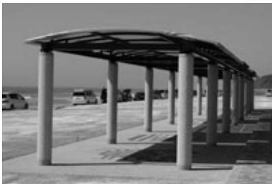
小島町に整備された日よけ施設