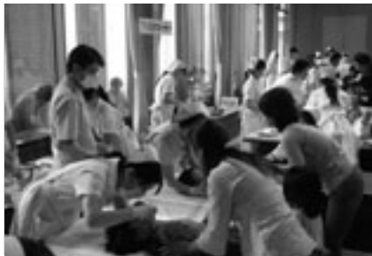
フッ素塗布のようす

とき: 6月8日(日)午前9時30分～午後2時(雨天決行) ところ: 市役所東館1・13階、豊橋公園 内容: ①成人の歯科相談・歯の健康度の測定②乳幼児のフッ素塗布・歯科健診・歯科相談③矯正歯科相談コーナー④親子で歯の健康教室(乳幼児対象)⑤骨密度測定⑥歯の健康ウォークラリー⑦口臭測定・口からストレスチェック⑧市民健康講座「先生教えて!生活習慣病と歯の関係」など 参加料: 無料 その他: 「歯っぴ〜ノート」のある方は持参してください 問合せ先: 豊橋市歯科医師会(☎62・1565)、健康課(☎51・2384)