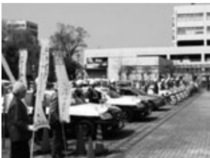
4月3日に行われた交通安全・地域安全合同出発式のようす