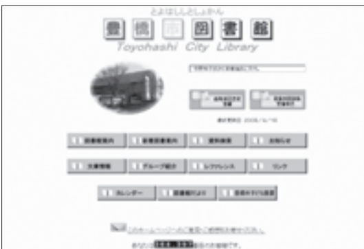
現在の図書館ホームページ

予約限度 1人10冊(窓口予約分含む) 予約対象の本 中央図書館・配本センター所蔵本 登録 従来の利用登録(貸出券交付)に加え、Eメール登録が必要です。6月7日(土)以降、図書館のホームページ( http://www.library.toyohashi.aichi.jp/ )、携帯電話ホームページ( http://www.library.toyohashi.aichi.jp/mobile/ )上で登録 本の受取 中央図書館、配本センターの2か所から選択