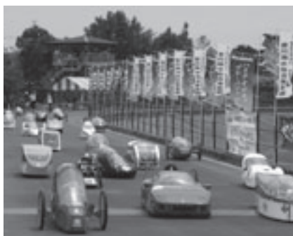
エコテクノレース

とき: 予選/5月31日(土)午前10時～午後4時、決勝/6月1日(日)午前9時30分～午後4時45分 ところ: 万場調整池特設コース(西赤沢町) 内容: 全国から集まる約100台が制限時間内に決められたエネルギー量を使い、走行距離を競います。部門/二輪車、WEM-GP、燃料電池車、三・四輪車 観覧料: 無料 その他: 渥美線大清水駅から無料タクシー運行 問合せ先: エコカーチャンピオンシップ運営委員会(商工会議所内 ☎53・7211 ☎53・7210) http://www.toyohashi-cci.or.jp/kanko/eco-car/ 、商業観光課(☎51・2430)