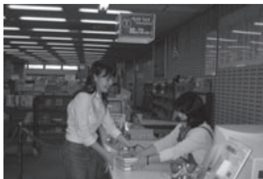
図書館での貸出の様子