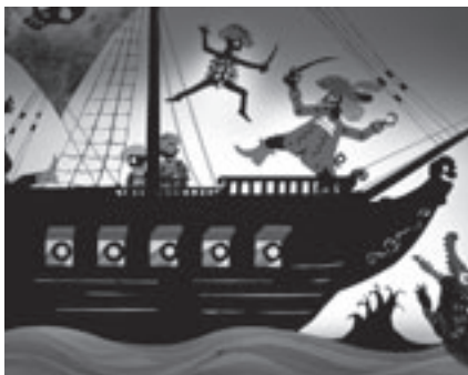
音楽影絵劇ピーター・パン

とき: 8月7日(木)午後2時 ところ: 市民文化会館(向山大池町) 内容: 第1部/ピアノ・チェロ・ヴァイオリンの生演奏によるコンサート、第2部/音楽影絵劇ピーター・パン 入場料: 全席自由。一般2,000円、高校生以下1,000円 出演: ピアノトリオ「プルミエ」 チケットの発売: 5月31日から豊橋文化振興財団事務所、ライフポートとよはし総合案内所、豊橋丸栄プレイガイド、カルミアサービスセンター、オリエント楽器豊橋店、チケットぴあ(☎0570・02・9999 [Pコード:386-576])、6月2日から市役所じょうほうひろば 問合せ先: 豊橋文化振興財団(市民文化会館内☎61・6145)