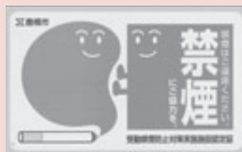
禁煙認定証(ステッカー) ※赤色