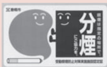
分煙認定証(ステッカー) ※青色

http://www.city.toyohashi.aichi.jp/kenkou/tobacco.html