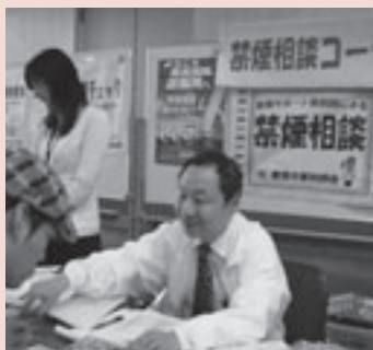
薬剤師・保健師が相談に応じます