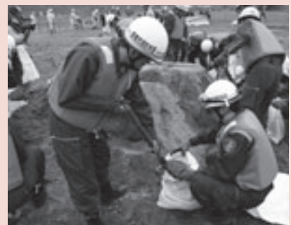
水防訓練のようす