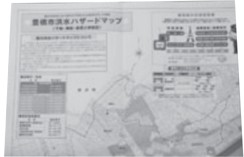
洪水ハザードマップ