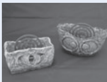
蚊取り線香器(作品例)

「共通事項」ところ みどりの協会(豊橋総合動植物公園東門) 入園料: 無料 申し込み: それぞれ の期日までに返信先明記の往復はがき(1枚2人まで)で講座名、参加者全員の郵便番号・住所・氏名・電話番号・市外在住の方は勤務先または学校名を豊橋みどりの協会(〒441-3147大岩町字大穴1-238) 参加料: 明記していないものは無料(総合動植物公園入園料必要) 申し込み: 明記していないものは不要