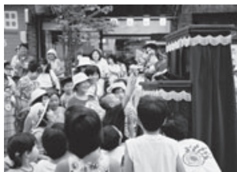
中心市街地での公演のようす

世界10か国より13劇団を迎え、国際色も豊かに国内外合わせて300を超える人形劇団が、市内の約100会場で400以上のパフォーマンスを繰り広げる日本最大の人形劇の祭典です。街中が人形劇一色に染まる特別な9日間。多彩な企画や催し物を盛りだくさん用意して、多くの皆さまのお越しを心よりお待ちしております。