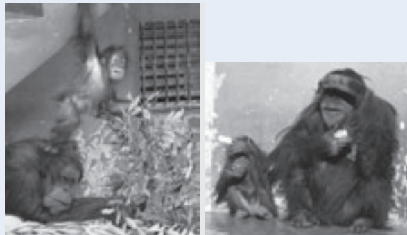
お母さんのマネをするやんちゃなウランちゃん

オランウータンは3歳からの1年で驚くほど大きくなるようです。とってもちっちゃいウランちゃんを見られるのは今しかありません。