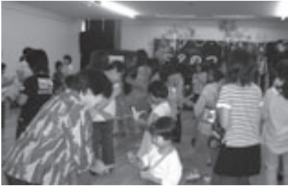
セタにちなんだゲームのようす

とき: 7月6日(日)午後1時~3時 ところ: 青少年センター(牟呂町字東里) 対象: 市内在住の小学生と家族 内容: ミニ笹飾り作り、セタにちなんだゲームなど 講師: レディースレクわたぼうし 定員: 50人(申込順) 参加料: 無料 申し込み: 6月11日から青少年センター(☎46・8925)