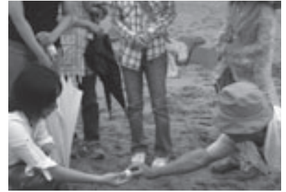
海岸での産卵調査のようす

とき: 7月12日(土)午後1時~5時30分(午後9時から3時間程度の夜間調査にも参加可) ところ: 表浜海岸、五並地区市民館(細谷町字上大附) 対象: 高校生以上 内容: 講義「アカウミガメの生態」「表浜の地形と植物」と海岸でのアカウミガメの上陸・産卵調査、海岸での夜間調査(希望者) 定員: 20人(申込順) 参加料: 無料 申し込み: 7月4日までに代表者の住所・電話番号と参加者全員の氏名・年齢・夜間調査への参加の有無を環境保全課(〒440-8501住所不要☎51・2385 ☎56・5126 ☎kankyohozen@city.toyohashi.lg.jp)