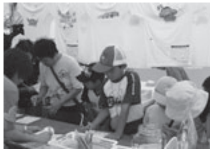
エコキャラバン2007のようす

対象: 小・中学生と保護者 定員: 40組(抽選) 申し込み: 7月25日までに申込用紙でエコカーチャンピオンシップ運営委員会(商工会議所内〒440-8508 住所不要 ☎53・7210) ※申込用紙はホームページ( http://www.toyohashi-cci.or.jp/kanko/eco-car/ )で配布中 [共通事項] 参加料: 無料(こども未来館施設利用は一部有料) 問合せ先: エコカーチャンピオンシップ運営委員会(商工会議所内☎53・7211)、商業観光課(☎51・2430)