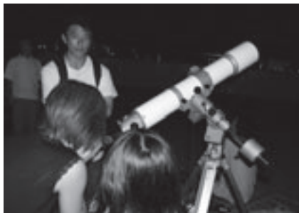
星空観望会のようす

とき: 8月8日(金)午後7時～9時(雨天・曇天の場合は9日(土))。延期・中止は当日午後4時に判断、ホームページ( http://www.toyohaku.gr.jp/chika/ )、電話でお知らせします ところ: 地下資源館屋上 対象: どなたでも(中学生以下は保護者同伴) 内容: 夏の主な星座や上弦の月、木星、流星の観察をします その他: 屋上に寝転がれるようにシートやクッション持参