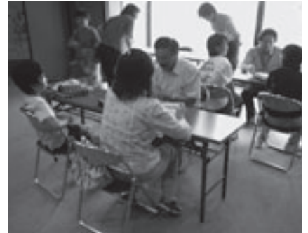
自由研究相談のようす

とき: 7月23日(水)午前10時～正午 ところ: 地下資源館(大岩町字火打坂) 対象: 小・中学生(保護者同伴可) 内容: 学芸員が相談に応じます