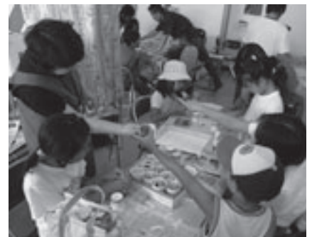
楽しい工作・科学マジックタイムのようす

とき: 7月27日(日)午後1時～3時(随時参加可) ところ: 視聴覚教育センター(大岩町字火打坂) 内容: サイエンス・ボランティアと、かんたんな工作、科学あそび体験、小型ロボットの操作などを楽しみます