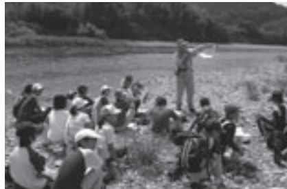
野外観察会のようす

とき: 8月7日(休)午前9時～午後4時(雨天の場合8日(金)) ところ: 豊橋市、新城市ほか 対象: 小学4年生以上 内容: 豊川の石のふるさとをバスで訪ねて東三河の大地のなりたちをさぐります 講師: 当館学芸員 定員: 25人(申込順) 参加料: 300円 申し込み: 7月23日午前9時から地下資源館