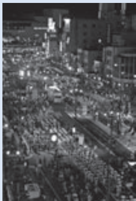
おどり手であふれる駅前大通り

「豊橋音頭」「新のんほい節」「ちぎり音頭」「新・豊橋とんとん唄」「マツケンのええじゃないかII」の5曲にあわせ、市中心部を踊りの輪で埋めつくしましなう。 とき 10月18日(土)午後6時30分～8時(小雨決行。雨天順延19日(日)) ところ 駅前大通り、広小路通り(配列は申込順に駅前大通り北側・南側、広小路通り) 対象 10人以上の団体 定員 限りあり 参加料 無料 その他 詳細は申込用紙をご覧ください 申し込み 9月1日(必着)までに申込用紙で豊橋まつり振興会(商業観光課内〒440-8501住所不要 ☎55・9090) ※申込用紙は市