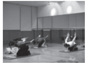
ヨガの講座のようす

日程など: 10月2日から各曜日(下表) ところ: 勤労青少年ホーム(神野ふ頭町ライフポートとよはし内)。硬式テニスはアルデックススポーツガーデン(菰口町二丁目) 対象: 市内在住・在勤のおおむね35歳未満の勤労者 その他: 参加料のほか利用年会費が必要。ホームページ( http://www.tees.ne.jp/~toyohashi-kh/ )で申込状況を確認できます 申し込み: 8月31日(必着)までに住所、氏名、年齢、電話番号、勤務先、勤務所在地、希望講座名を勤労青少年ホーム(〒441-8075 神野ふ頭町3-22 ☎33・0555 ☎33・1919 📧toyohashi-kh@tees.jp)