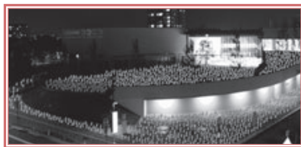
「こども未来館ここにて」でのキャンドルナイト(イメージ)

当日のボランティアを募集します。申込方法などはチラシ、ホームページをご覧ください。