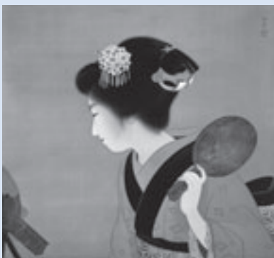
上村松園「鴛鴦髻」(昭和10年)

とき 10月4日(土)～11月16日(日)(月曜日休館。ただし10月13日、11月3日は開館し、翌日休館)午前9時～午後5時(初日は午前11時から) ところ 美術博物館(豊橋公園内)※10月18日・19日は豊橋まつりのため駐車場を利用できません。公共交通機関を利用してください 観覧料 一般・大学生1000(800)円、小・中・高校生4000(300)円。ダブルチケット14000(二般・大学生の前売りのみ、1人2回または2人1回観覧可)※( )内は20人以上の団体および前売料金。前売券・ダブルチケットは美術博物館、二川宿本陣資料館、市役所じょうほうひろば、チケットぴあ、ファミリーマート、