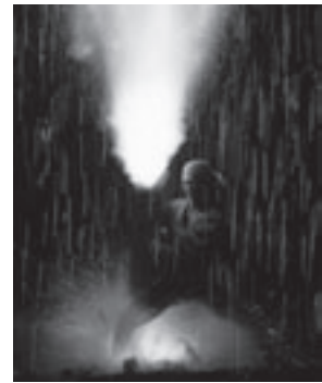
手筒花火のようす

時間: 午後6時～8時30分(午後5時開場) ところ: 豊橋球場内特設ステージ 内容: 一般参加によるヨウカン(ミニ手筒)花火一斉揚げ、手筒花火、和太鼓「志多ら」演奏、長篠設楽原鉄砲隊実演など 入場料: 詳しくは本紙7月15日号9ページ ※内容・時間は若干、変更になる場合あり