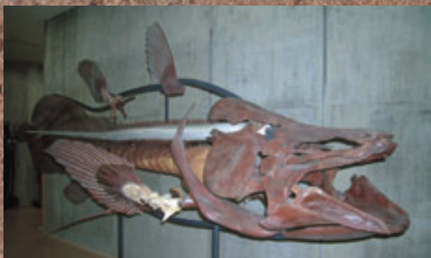
世界最大のシーラカンス化石

世界最大のシーラカンス化石（全身復元骨格、3.8m）をはじめ、数百点ものブラジル産魚類化石たちが豊橋にやってきます。「離れた位置にある大陸なのに、よく似た生物が分布しているのはなぜ？」、「大昔は大陸がつながっていたの？」という疑問に対するひとつの答えとして魚類化石を展示します。最先端のシーラカンス研究を紹介、貴重な映像なども見ることができます。