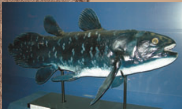
現生のシーラカンス模型

9月19日金～11月16日日 （月曜日休館。ただし10月13日祝、11月3日祝）は開館し、10月14日火、11月4日火は休館）