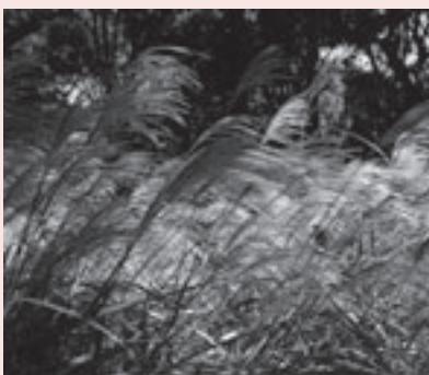
風になびくススキの穂

屋外植物園の「七草の園」には小型のイトススキや大型のハチジヨウススキなど8種類のススキが植えられており、彼岸ごろから順次、穂を出し始めます。これからが見頃のススキをぜひ見に来てください。