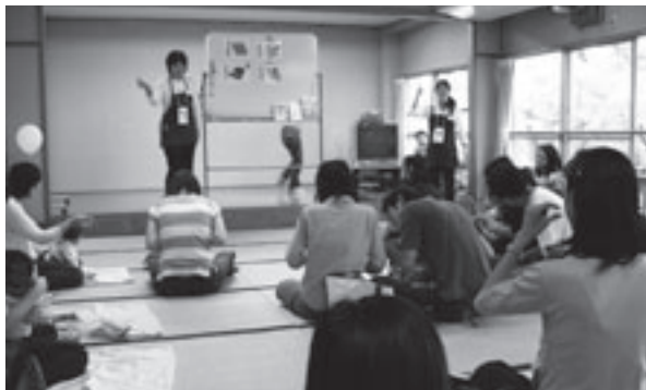
ベビーサイン&タッチケア体験会のようす

時間 午前9時30分、正午 定員 各100人(先着順) 提供 財団法人豊橋みどりの協会