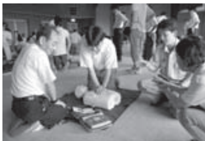
AED操作を学ぶようす

対象: 中学2年生以上 内容: 事故現場などに居合わせた時、適切な応急手当ができるように知識、技能を身に付けます 定員: 30人(申込順) 受講料: 無料 その他: 修了者には修了証を交付。受講後2年を経過する方も、救命技能の維持向上のため再度受講してください。駐車場は中消防署の東側訓練場を利用してください 申し込み: 11月9日までに中消防署(☎52・0119)