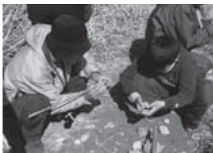
三河地学めぐりのようす

とき: 11月22日(土)午前9時30分～午後3時30分(雨天順延23日(祝)) ところ: 新城市ほか 集合・解散: 自然史博物館 対象: 小学4年生以上 内容: バスで中央構造線沿いに東三河を縦断し、貝の化石や地層の観察をします 講師: 当館学芸員 定員: 25人(抽選) 参加料: 300円 申し込み: 11月12日(必着)までに返信先明記の往復はがきで教室名、参加者全員の住所・氏名・年齢・電話番号を自然史博物館(〒441-3147大岩町字大穴1-238) 問合せ先: 自然史博物館(☎41・4747)