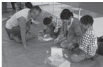
くらふとフェアでの「木好きらく会」のブース 工作教室で子どもとのふれあい