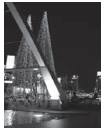
ライトアップされた豊橋駅前

[共通事項] 参加料: 無料 問合せ: イルミネーションフェスティバル実行委員会事務局(豊橋商工会議所内 ☎53・7211 ☒53・7210)、商業観光課(☎51・2425)