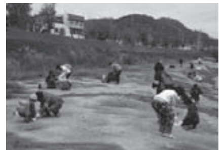
化石発掘を楽しむ家族

とき: 12月7日(日)午前8時45分～午後4時30分 集合・解散: 自然史博物館 ところ: 岐阜県瑞浪市(バス使用) 対象: どなたでも(小学生以下は保護者同伴) 内容: 1600万年前のサメ・貝化石などを掘ります。雨天の場合は瑞浪市化石博物館で特別講義を行います 講師: 当館学芸員 定員: 40人(抽選) 参加料: 1,000円 申し込み: 11月19日(必着)までに返信先明記の往復はがきで教室名、参加者全員の住所・氏名・年齢・電話番号を自然史博物館(〒441-3147大岩町字大穴1-238) 問合せ先: 自然史博物館(☎41・4747)