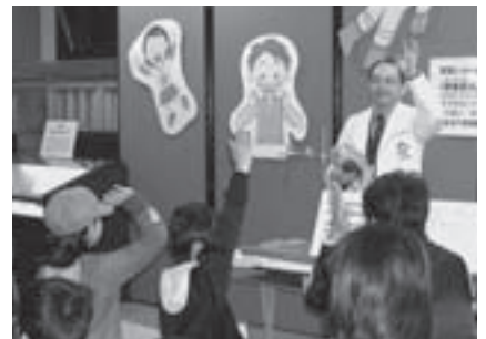
静電気の実験の様子

とき: 1月11日～2月22日の日曜日・祝日午後2時20分(約25分) ところ: 地下資源館(大岩町字火打坂) 内容: 静電気の不思議な性質とその発生のしやすさなどを実験とクイズで紹介しします。参加できる実験もあります 参加料: 無料 申し込み: 不要 問合せ: 地下資源館(☎41・2833)