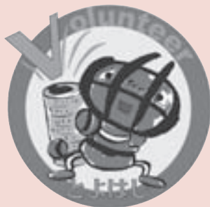
ボランティアマーク

改修工事期間: 3月下旬まで 問合せ: 豊橋警察署大崎駐在所 ☎54・0110 内線540