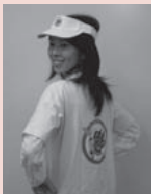
使用例(Tシャツとサンバイザー)