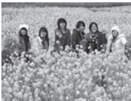
満開の菜の花畑のようす

「常春の渥美半島」では、1月上旬から約1千万本の菜の花が咲き乱れ、一足早く春の息吹を感じることができます。期間中は、さまざまなイベントを開催します。 ■菜の花祭り とき 午前9時～午後4時 ところ 伊良湖ガーデンホテル(田原市伊良湖町)前の菜の花畑 内容 菜の花をお土産に(5本100円) ■でっかい菜の花畑 ところ フラワーパーク跡地(田原市堀切町) 内容 約4ヘクタールの菜の花畑 ■青空市場 とき 2月14日(土)・15日(日)午前10時～午後3時 ところ 伊良湖ガーデンホテル前の菜の花畑 内容 渥美半島の特産品販売、あさり汁・郷土料理「じよじよ切り」の無料サービス。「じよじよ切り」は15日のみの配布