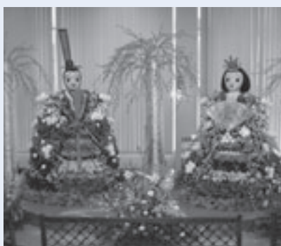
フラワーアレンジメントのお雛様とお内裏様