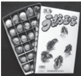
商品例(箱入りうずらの卵)

とき: 3月6日(金)午後1時～5時 ところ: 市役所東128会議室(東館12階) 内容: 産出額日本一の豊橋うずらの紹介、卵の食育・地産地消に関する講演、飼養衛生管理マニュアルの紹介、卵とその加工品などの展示 定員: 75人(申込順) 参加料: 無料 申し込み: 2月27日までに農政課(☎51・2459)