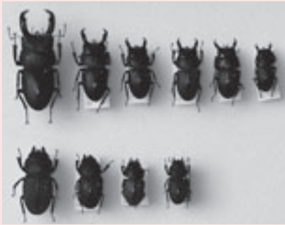
スジプトヒラタクワガタの標本

とき 2月28日(土)～4月5日(日) 内容 新生代のカエルの化石や日本産クワガタムシの標本など、新しく収蔵した資料を公開します