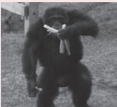
長ネギを食べるチンパンジー

気温が低く空気が乾燥している2月は、人間だけでなく動物も風邪をひきやすい時期です。のんほいパークでは冬季の風邪予防の二環として、3年前からチンパンジーに長ネギを与えています。長ネギには、ネギオールという抗菌作用のある成分や、疲労回復効果が期待できるアリシンなどが含まれており、私たち人間の世界では昔から風邪の民間療法として用いられてきました。生だと独特の匂いと味がする長ネギですが、チンパンジー達は喜んでムシャムシャとほおばり、手をかざして「おかわり」を要求することもあります。