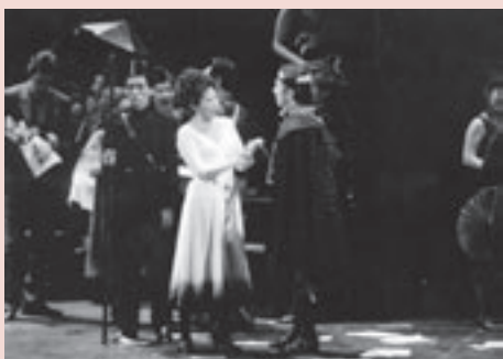
カルメン上演の様子