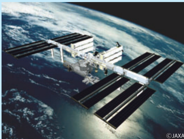
建設がすすむ国際宇宙ステーション

宇宙から地球を観測することで、大地の複雑な地形が立体的に見え、海流や大気の様子、災害や汚染の状況、資源の分布やオゾンホール、土地利用のようすなど多くのことがわかります。宇宙航空研究開発機構(JAXA)の各種ロケット、観測衛星、国際宇宙ステーションの模型などを展示し、宇宙から地球を観測して明らかになってきたことを紹介します。また、美しい映像や実験などで宇宙のふしぎを体験できます