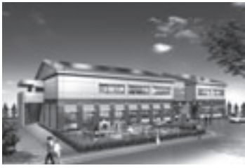
牟呂地域福祉センター

4月1日(水)に牟呂地域福祉センターがオープンし、4月6日(月)に新たな西部窓口センターが牟呂地域福祉センター内に設置されます