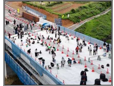
▲ 新しい橋(柿景橋)におえかき

地域の皆さまや工事業者様、イベント参加者様のご協力により、おかげさまで大盛況でした！ 中日新聞(4月30日朝刊)、東愛知新聞(4月30日朝刊)、ティーズにも取り上げていただきました！ このイベントをきっかけに、より一層校区が活性化するよう、引き続き活動していきます！