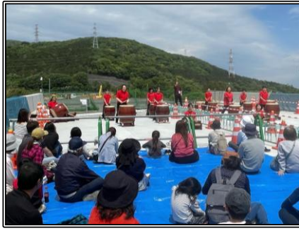
▲ 新緑コンサート(和太鼓)