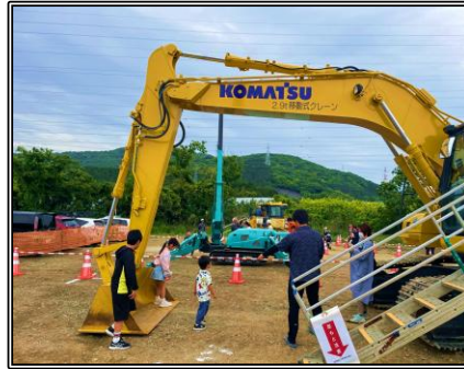
▲ はたらく車大集合！