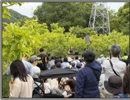
▲ 新緑コンサート(マリンバ)