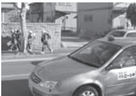
青色回転灯を利用した地域パトロール