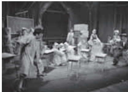
出現!ラクダ大サーカス団!