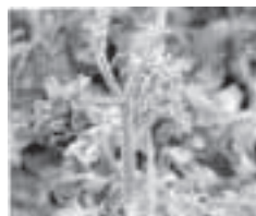
新芽に現れた葉巻症状

問合せ先: 市役所農政課 (☎ 51・2475)、JA豊橋営農指導課 (☎ 25・3814)、愛知県東三河農林水産事務所農業改良普及課 (☎ 63・3529)