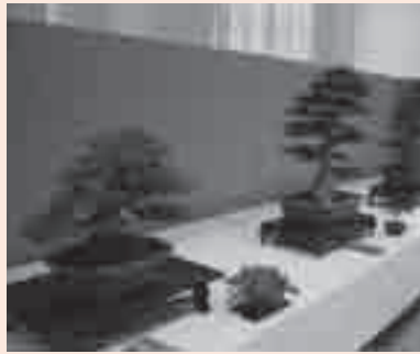
さつきの盆栽展示の様子

とき 11月13日(土)・14日(日)と ところ 温室内イベントのへや 内容 さつきの盆栽を約15点展示します