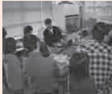
収蔵庫たんけんの様子

とき 11月13日(土)午後1時20分(約40分) 内容 博物館に収蔵されている骨格標本と、その製作過程を見学します 定員 30人(先着順)