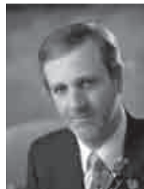
ライナー・ホーネック