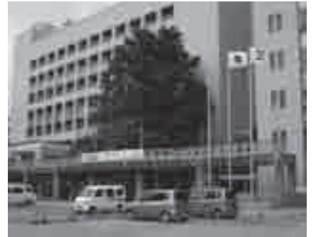
東館前地上駐車場

問合せ: 財産管理課 (☎51・2125) ※当日は夜間・休日窓口 (☎51・2421)