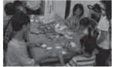
おもしろサイエンスの日のようす

とき: 11月28日(日)午後1時～3時(随時 参加可) ところ: 視聴覚教育センター (大岩町字火打坂) 内容: 「身近な材 料で楽しい工作」をテーマに、サイエ ンス・ボランティアといっしょに、か んたんな工作や科学あそびを体験しま す。一度にいくつも参加して楽しめま す 参加料: 無料 申し込み: 不要 問 合先: 地下資源館(☎41・2833)