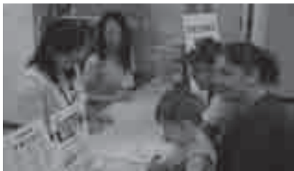
豊橋市国際交流協会窓口の様子

採用予定職種／人員: 事務嘱託員／2人 給与: 給料のほか期末手当など各種手当を支給 応募資格: 国際交流・国際協力に関心があり、英語で日常会話ができ、パソコン操作に習熟した方。年齢・性別・学歴・国籍不問 採用予定日: 平成23年4月1日 募集要綱の配布: 豊橋市国際交流協会、市役所多文化共生・国際課(東館3階)、ホームページ( http://www.toyohashi-tia.or.jp/ )で配布中 試験: 12月19日(日)／小論文筆記と面接 その他: 詳しくは募集要綱参照 申し込み: 郵送の場合は12月6日(必着)までに、持参の場合は12月1日～6日に豊橋市国際交流協会(〒440-0888 駅前大通二丁目33-1 開発ビル3階 ☎55・3671)