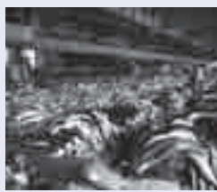
水揚げされたサメ